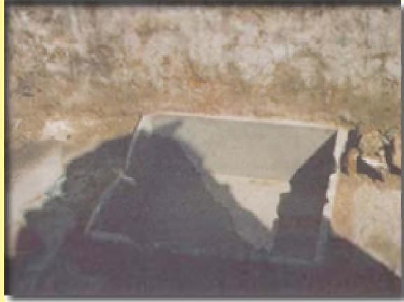
ئەو حەوزە بەر ئێفەهێ گە ئاوی تێدەگراو پێخە مەبەر سەلامی خوای لەسەر بێ دەسنوێزی تیا دەگرت